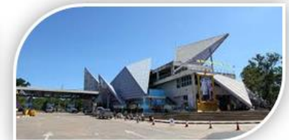
ภาพประกอบ ข้อ ๗ การเตรียมความพร้อมด้านเศรษฐกิจและความมั่นคงชายแดน