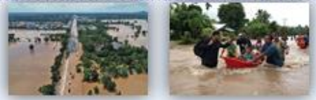
ภาพประกอบ ข้อ ๓ การบริหารจัดการน้ำลุ่มน้ำและปลายน้ำ