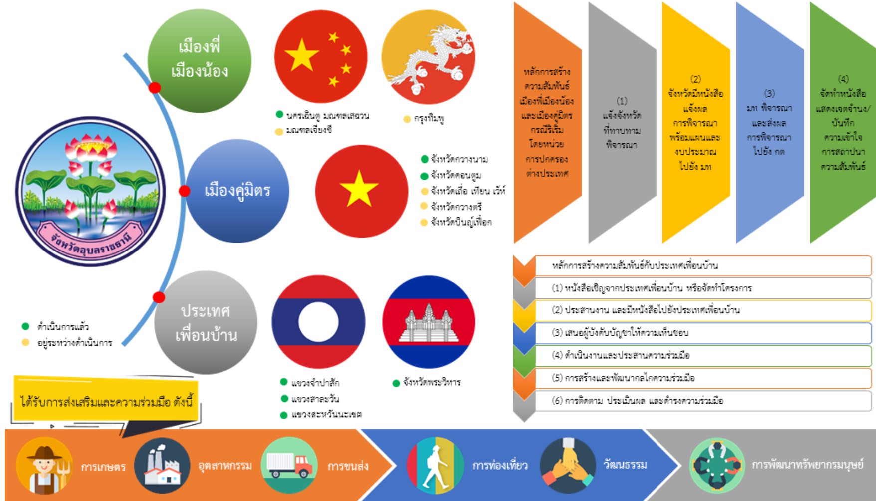
ภาพประกอบ ข้อ ๕ การเสริมสร้างความสัมพันธ์จังหวัดชายแดน เมืองพี่เมืองน้อง และเมืองคู่มิตร

(การพัฒนาความสัมพันธ์แลกเปลี่ยนความร่วมมือในระดับท้องถิ่น)