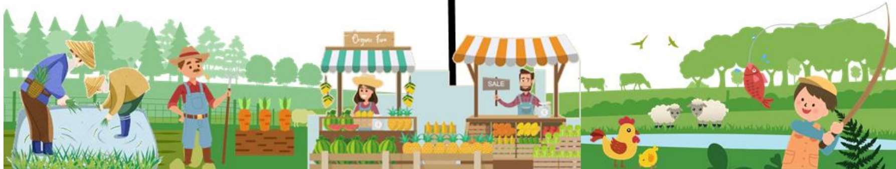
ภาพประกอบ ข้อ ๖ การพัฒนาเศรษฐกิจฐานรากและประชารัฐ